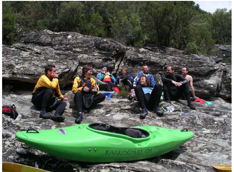
Gruppe am Vecchio

In der restlichen Zeit genossen wir eine gute Zeit auf den Korsischen Bäche (Mittlerer Golo, Standardstrecke Asco, Unterer Vecchio und die Tavinianoschlucht). Die Flussbeschreibungen können aus dem Internet