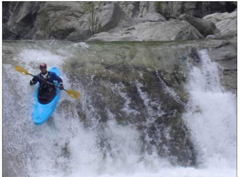
Kasi, nach dem Lager auf dem Travo

Auf den Kajaktouren kam es nur zu kleineren Zwischenfällen, mal ein kleines unfreiwilliges Bad, mal auf einem Stein gestrandet oder vielleicht mal in der ein-