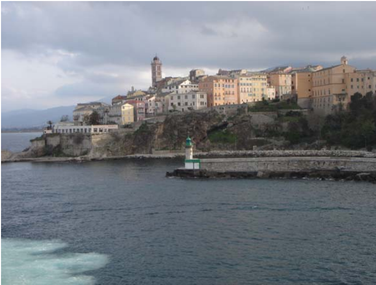
Einfahrt in den Hafen von Bastia