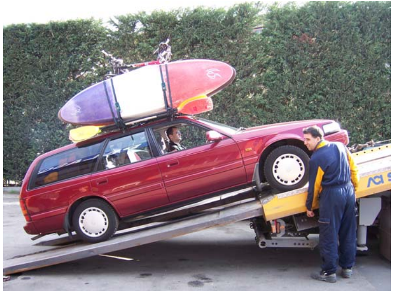
Verlad, Vorort von Parma