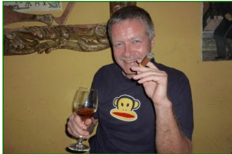
Mit Cohiba und Havana Club (7-jährig), auf Kuba